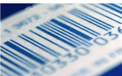
Identificación automática por medio de sistemas de radio frecuencia.